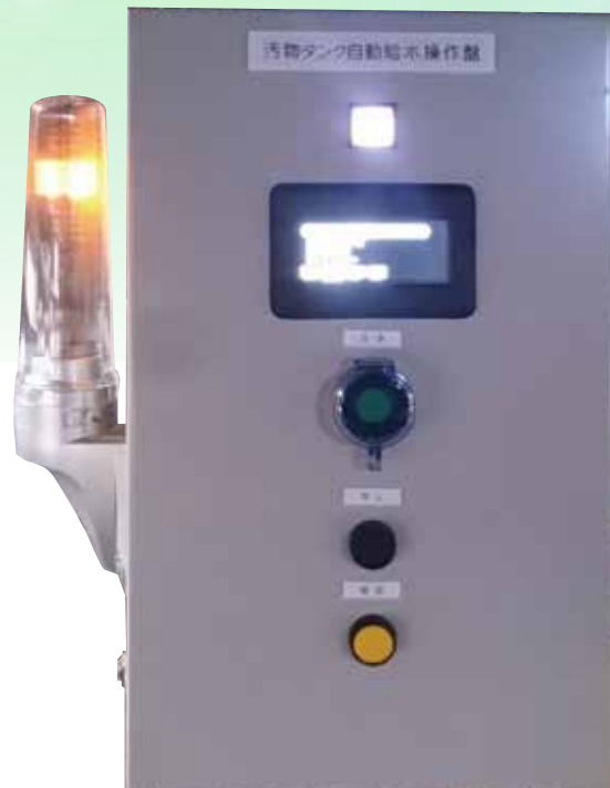
汚物タンク自動給水操作盤

本装置はタンク内の洗浄、及び給水を自動制御する装置です。自動で洗浄を行い、一定時間後に排水バルブを閉じ、自動給水を行います。