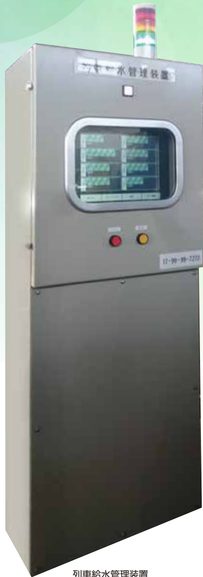
列車給水管理装置

本装置はタンク内の洗浄、及び給水を自動制御する装置です。自動で洗浄を行い、一定時間後に排水バルブを閉じ、自動給水を行います。